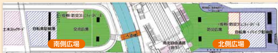
完成予想図(平成29年度予定)

都道環状6号線中井富士見橋高架下の空間を活用し、中井駅駅前広場、自転車等駐輪場、妙正寺川人道橋などの公共施設を整備します。また、中井駅周辺の防災拠点として、地域の要望を踏まえた防災コミュニティスペースや災害用マンホールトイレの整備を行います。