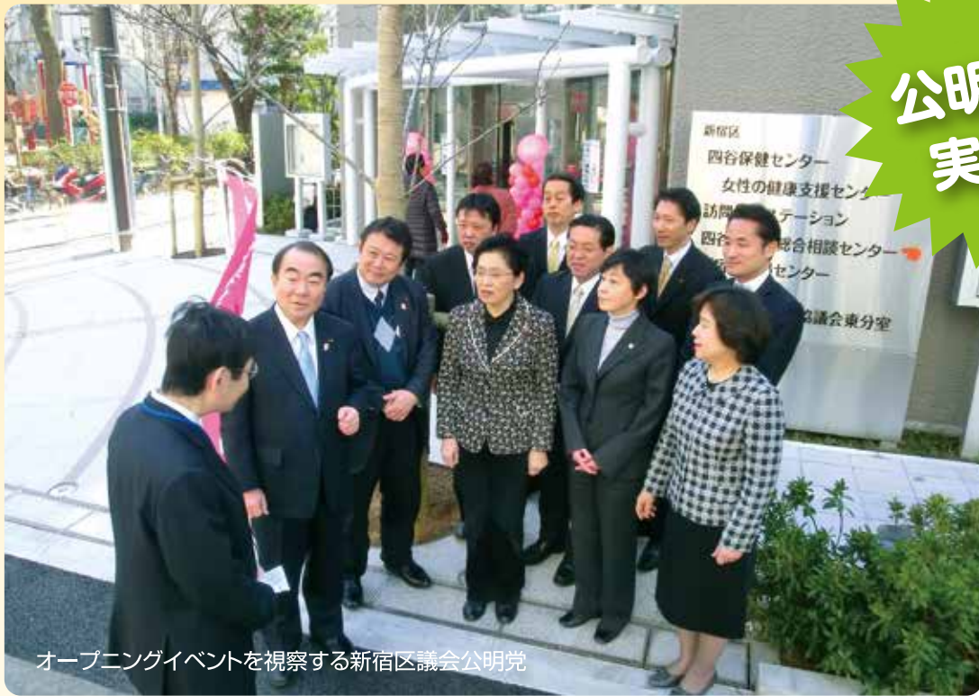
オープニングイベントを視察する新宿区議会公明党