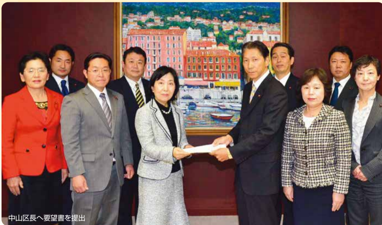
中山区長へ要望書を提出